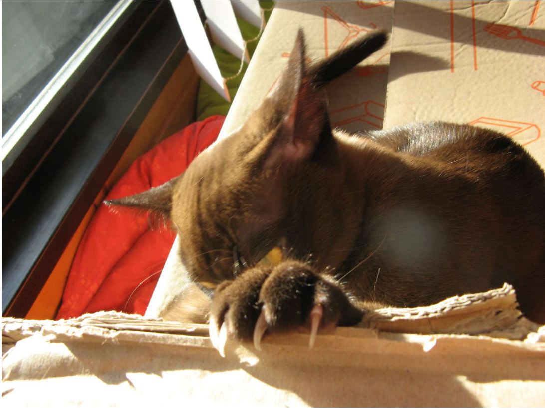
Mann nennt sie auch „the E“ - Evil Emmie *Z I N G*