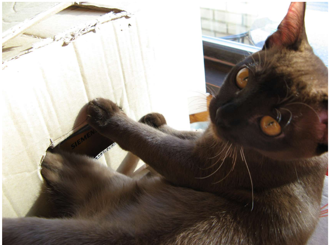
„Emmie, was machst du da?“ - „Öh, nūx!“