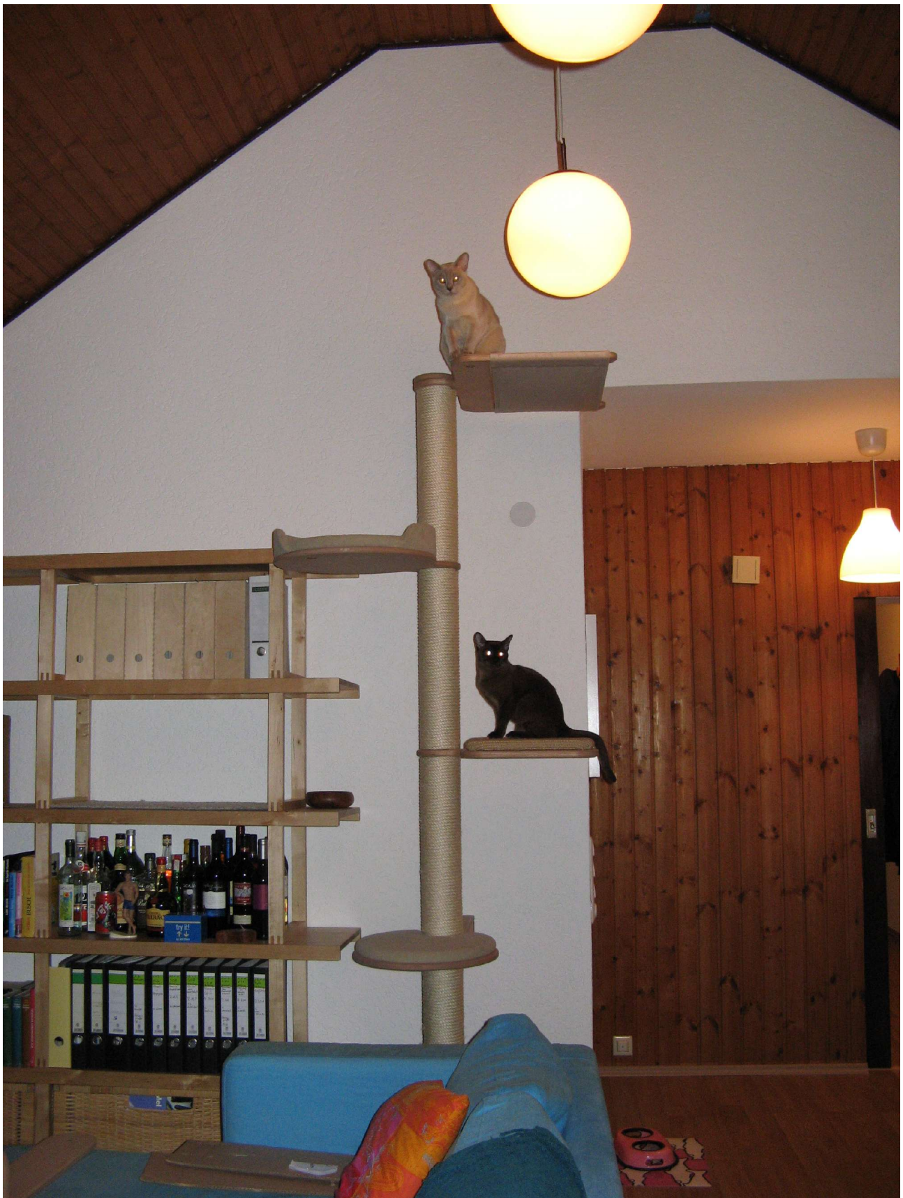
Unser mächtig prächtiger Traumbaum