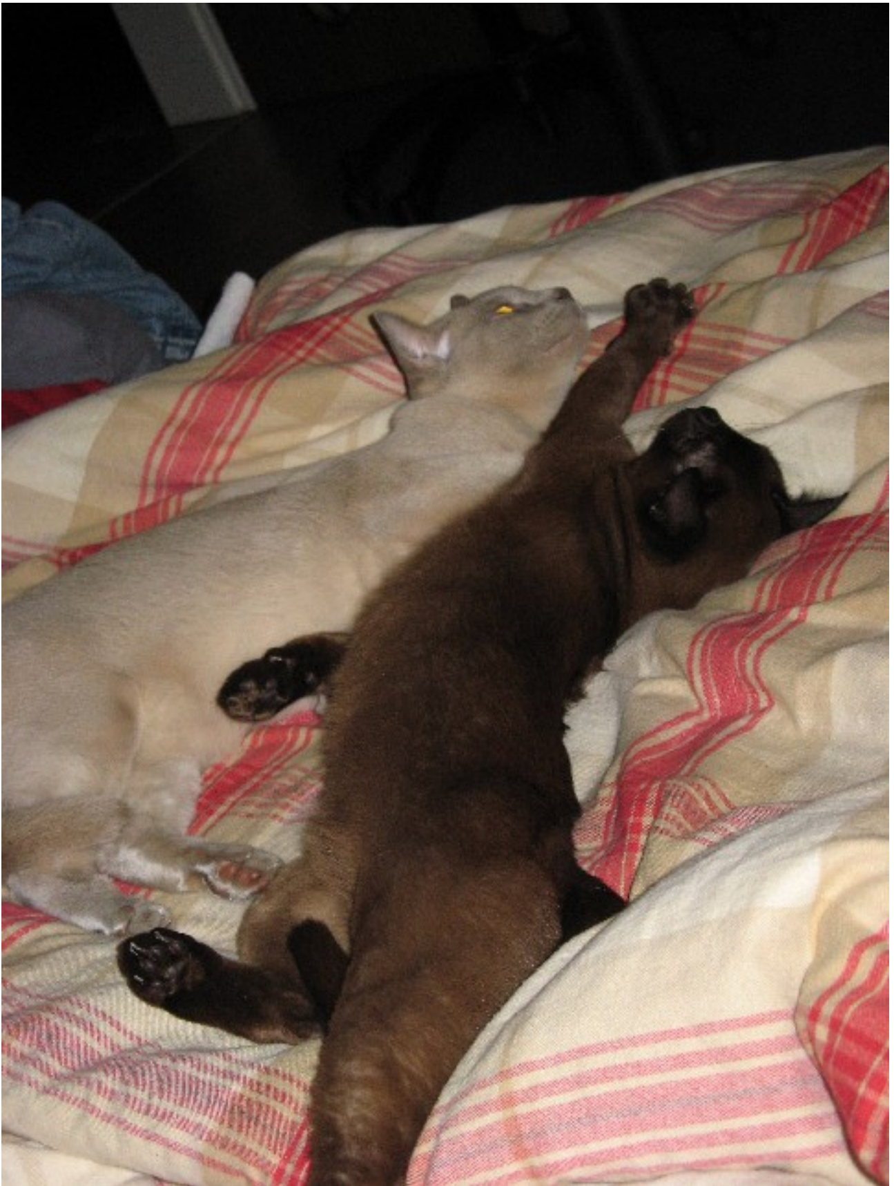
Die Pluchepeaus (ausgesprochen: Plüsch-Po's)